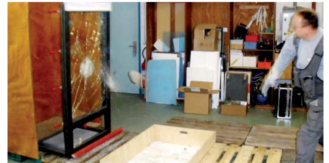
Der Bewurf mit dem 4 kg-Stein zeigt es deutlich, das Glas mit der Sicherheitsfolie ist durchwurfhemmend.

Rund 95% aller Einbrüche in Wohnobjekte erfolgen bei Abwesenheit der Bewohner und mehr als die Hälfte davon tagsüber. In der Schweiz wurde letztes Jahr mit Abstand am häufigsten in Ein- und Mehrfamilienhäuser eingebrochen: 16 505 Einbrüche in Mehrfamilienhäuser und 8 553 Einbrüche in Einfamilienhäuser wurden gemäss der Polizeistatistik 2010 angezeigt.