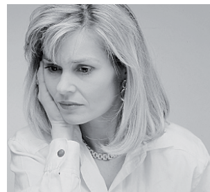
Schlimmes Gefühl danach.